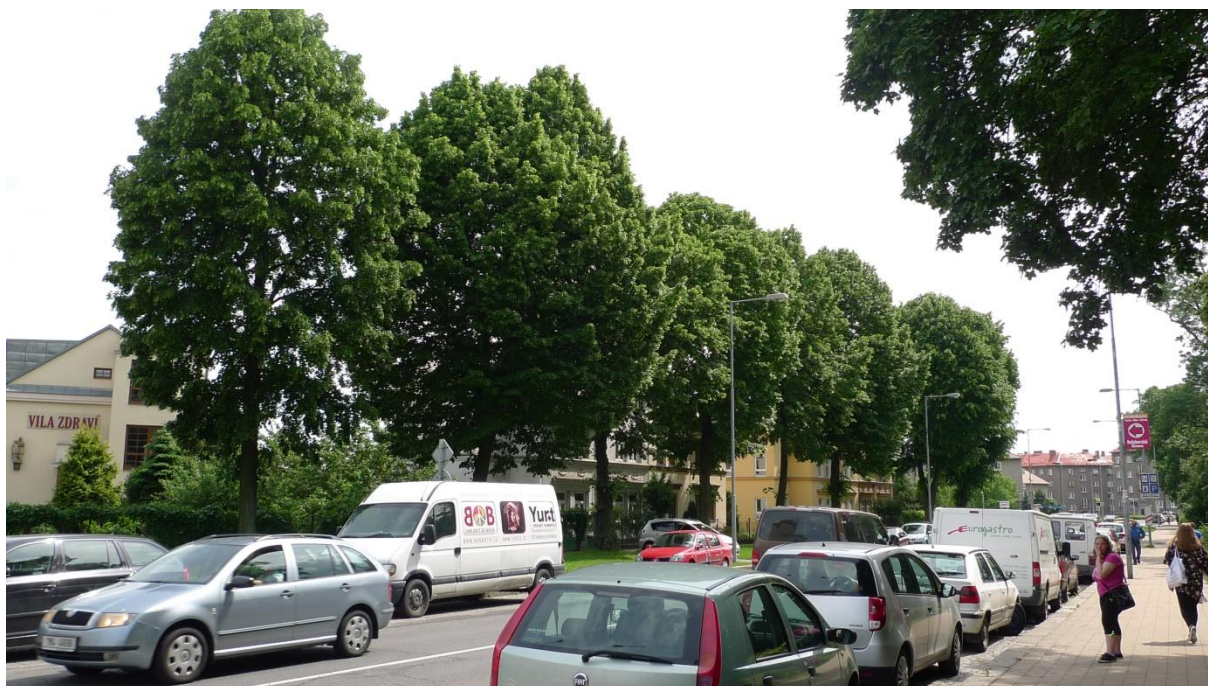
Obrázek 3: Lípy na ulici Polská jsou dobrého zdravotního stavu, a proto nebylo přistoupeno k jejich kácení.

Na ulici Polská bylo požadováno pokácení lip kvůli zanášení okapů a ohrožení pohybu osob. Zanášení okapů není zákonný důvod ke kácení, naopak provozní bezpečnost je. Proto jsme na místě posoudili stav dřevin. Dřeviny byly zdravé, stabilní, pouze na jednom ze stromů se nacházel útvar, který bývá hodnocen jako rizikový faktor růstu stromu. Naše negativní stanovisko ke kácení následně podpořila i AOPK ČR svým posudkem. Ke kácení této nádherné aleje tedy nedošlo.