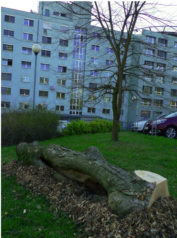
Obrázek 1: Logger - strom s vysokým entomologickým potenciálem ponechaný jako broukovště.

přepравky. Následně byl realizován záchranný transfer a netopýři byli zaevidováni a prohlédnuti v záchranné stanici ORNIS Muzea Komenského v Přerově.