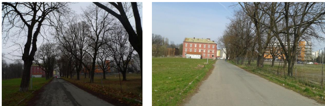
Obrázek 2: Původní (vlevo) a stávající alej (vpravo) na ulici Kavaléristů. Levá část byla vykácena kvůli protipovodňovým opatřením, část vpravo kvůli záměru vybudovat podzemní parkoviště a soukromé administrativní budovy.

Ve stejné lokalitě, jako bylo popisováno výše zmíněné kácení na nábřeží, bylo navíc zažádáno o kácení aleje mezi Moravskou univerzitou a ZUŠ Žerotín. Celkem se kácení týkalo cca 30ks vzrostlých jasanů, lip a bříz. Ke kácení jsme zaujali negativní stanovisko, protože se jednalo o dřeviny zdravotně v pořádku s vysokým biologickým potenciálem. Zachránit alej se snažila i cca desítka občanů, kteří společně sepsali petici a otevřený dopis proti kácení. Pod petici se za měsíc podepsalo více jak 800 občanů. Podařilo se nám prokázat význam lokality a to hlavně díky požadavku na vypracování biologického posouzení lokality. První předložený biologický posudek byl velmi nekvalitní a obsahoval závažné nedostatky z hlediska monitoringu a ochrany jak netopýrů, tak chráněných druhů hmyzu. Díky vyjádření ČESON a Mgr. Josefa Kašáka, které jsme si nechali vypracovat, Krajský úřad Olomouckého kraje změnil své vyjádření k potřebě výjimky na zásah do této lokality a investor/žadatel o kácení musí přepracovat původní posudek a navíc si i zažádat o výjimku dle podle § 56 zákona 114/1992 Sb.