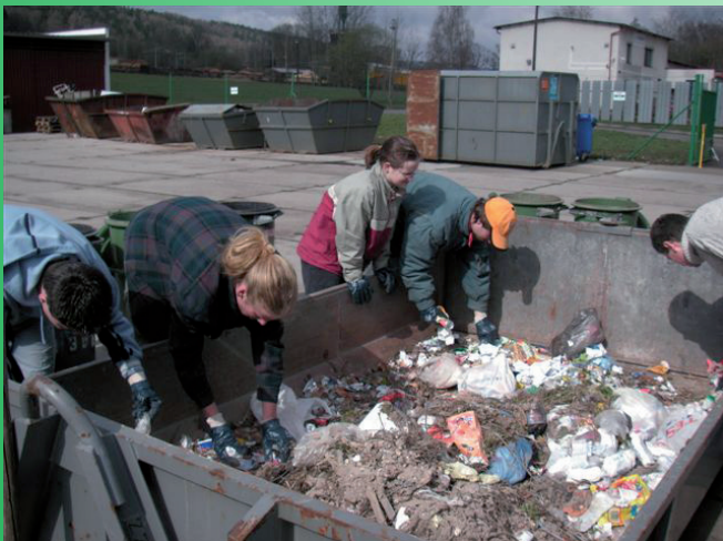
Rozbor odpadu ve Dvoře Králové.