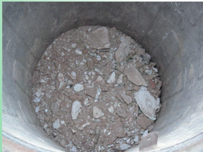
Stavební odpad do popelnice nepatří.